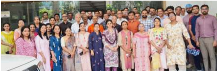
डॉक्टर व वैद्यकीय क्षेत्राची बदनामी केली जाते. ही बदनामी थांबवावी व डॉक्टरांवर होणारे चुकीचे आरोप थांबवावे या मागणीचे निवेदन आयएमए संघटनेच्यावतीने प्रांतविकाऱ्यांना देण्यात आले यावेळी संघटनेचे डॉक्टर मोठ्या संख्येने उपस्थित होते.

सदर उपचार महात्मा ज्योतिबा फुले जन आरोग्य योजनेअंतर्गत विनामूल्य करण्यात आले होते. पुढील उपचारादरम्यान रुग्णाला Acute Kidney Injury (AKI) ही गंभीर गुंतागुंत निर्माण झाली. त्यानंतर आवश्यक प्राथमिक उपचार करून, पूर्णविलंब नेफ्रोलॉजिस्ट उपलब्ध असलेल्या उच्चस्तरीय रुग्णालयात रुग्णाला रेफर करण्यात आले. दुर्दैवाने, रेफरलनंतर सुमारे तीन आठवड्यांनी डायलिसिसदरम्यान