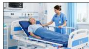
५० बेडचे सुसज्ज मल्टिस्पेशालिटी हॉस्पिटल