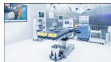
सुसज्ज ऑपरेशन थिएटर